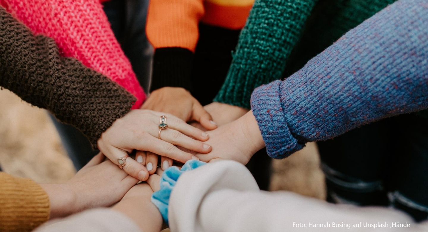
Hände